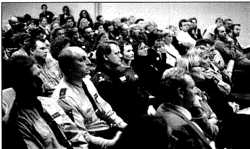
Ett par hundra poliser, socialarbetare, politiker och andra intresserade deltog i Youth at Risk-seminariet i Stockholm i november.

– Youth at Risk arbetar med hela omgivningen och inte bara med de unga människorna. Ungdomar speglar vuxnas beteende och de ändrar sig